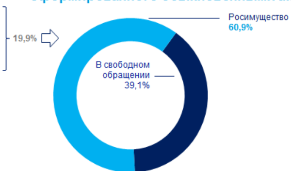
Рисунок 1. Структура акционерного капитала Банка ВТБ (ПАО).

Далее мы приведем структуру группы ВТБ взятую из годового отчета банка на последнюю отчетную дату (рис.2) отмечая тот факт, что сам Банк ВТБ (ПАО) является головным банком группы.